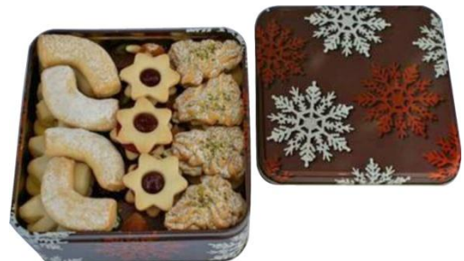
Dose Kristall, Inhalt 600 g – 900 g