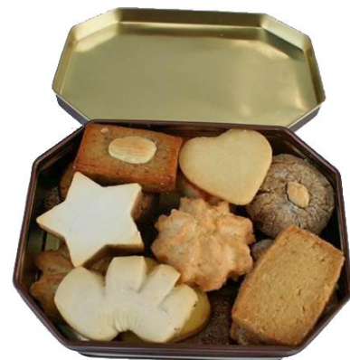
Dose achteckig, Inhalt 200 g

Postversandpackung Fr. 6.00 exklusiv Porto