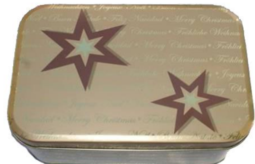
Dose Merry Christmas, Inhalt 740 g – 900 g